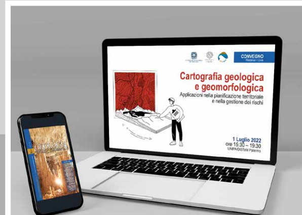
L'immagine è inserita a scopo illustrativo