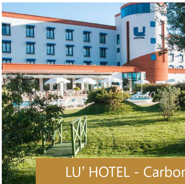
LU' HOTEL - Carbonia (Carbonia Iglesias)

comparto estrattivo, per evidenziare le criticità e problematiche manifestate e unitamente analizzare le prospettive, oggi sempre più concrete, di un potenziale rilancio del comparto, in conformità ad una armonica e sostenibile interazione uomo-ambiente e nel rispetto delle indicazioni date dalla Conferenza sul Clima (COP 26), tenutasi a Glasgow in Scozia nel Novembre 2021.